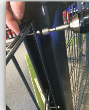
Montage der Gittermatte