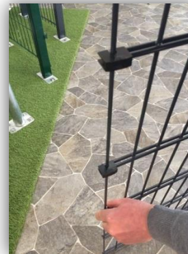
Montage der KU-Keile