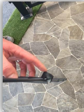
Montage der KU-Keile