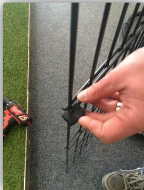
Montage der KU-Keile