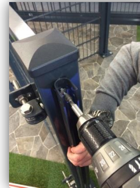
Montage der U-Leiste