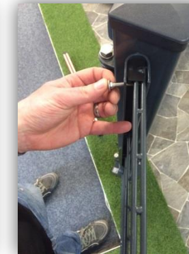
Montage der Gittermatte