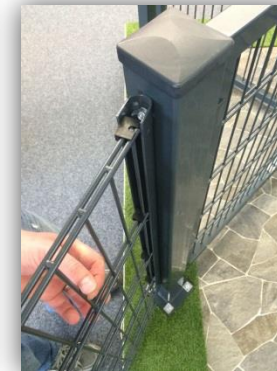
Montage der Gittermatte